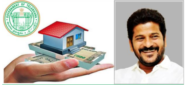
Indiramma Indlu Housing Scheme